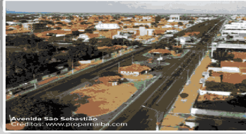
Avenida São Sebastião