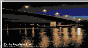
Ponte Simplicio Dias

Cidades: Weltony Ribeiro | Av. São Sebastião